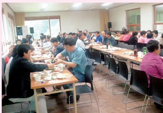
▲ 종회탐방 후 종친들과 함께 식사 장면

자녀중 학업성적이 우수하고 가정형편이 어려운 중·고생 10여명을 대상으로 매년 장학금을 지급하여 종회발전에 앞장서고 있다.