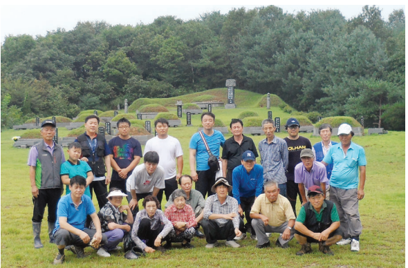
▲ 종중 묘역 별초 후 묘전에서