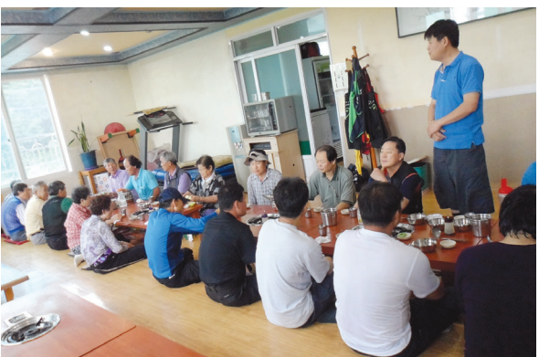
▲ 2012년 9월1일(토) 묘역 별초 후 일가들의 단란한 식사 모임

일가들이 단체로 연1회 여행도 함께하며 종친간에 우애를 다지고 있으며 선조님(19세조(燁之)의 묘역관리를 가정의 정원같이 정성껏 관리하고 있는 종회로 타종회로부터 부러움을 받고 있는 모범종회이다.