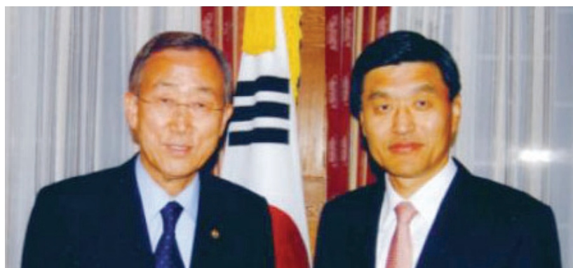
▲ 반 총장과 심의원은 10년 터울의 주.오스트리아 대사 선후배 사이다. <심윤조 의원이 주.오스트리아 대사시절 반기문 UN사무총장과 찍은 사진>

그는 지난 19대 총선에서 가장 늦게 선거운동에 뛰어들었지만 전국에서 최다득표로 당선돼 유명세를 타기도 했다. 국회 개원 이후에는 여의도연구소 제1부소장을 맡는다면 최근 재외국민위원회 본부장까지 맡는 등 당 내 주가가 연일 상한가를 기록하고 있다.