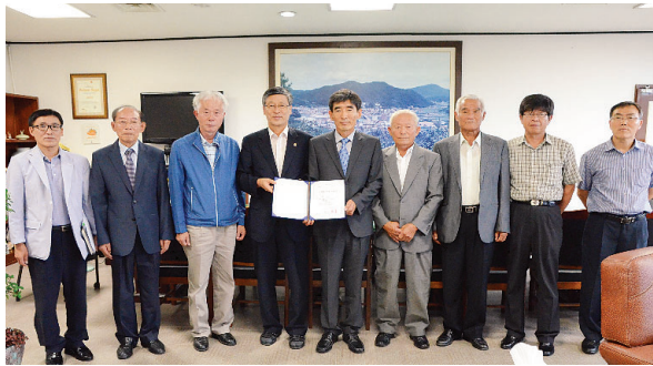
▲ 소류정 국가문화재등록 증서 전달식

지난 8월 9일 정부로부터 국가등록문화재 제497호로 지정·고시된 청송군 파천면 덕천리 121번지 소재 「소류정」 등록문화재 지정서 전달식이 지난 8월 24일 오후 2시 청송군수실에서 있었다.