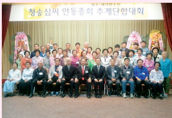
▲ 종회탐방 후 참석 종친들과 함께 (앞줄 중앙이 재덕회장)