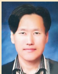
심 성 기 도총제공파 30세 이학박사 종보편집위원/대종회이사

宗報 편집위원 두 분을 9월 1일자로 증원 위촉하였습니다. 학계에서 존경받는 명망이 높은 宗親으로 「青松沈氏宗報」가 추구하는 새로운 가치 창출과 도약을 위해 기여해 주실 것입니다.