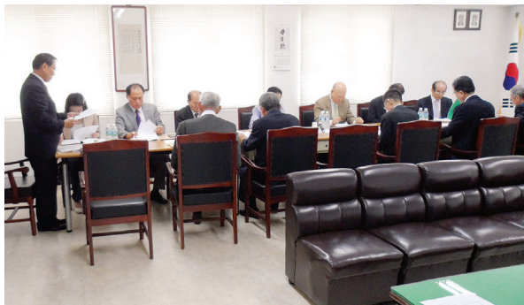
▲ 장학사업 담당 임원회의 모습