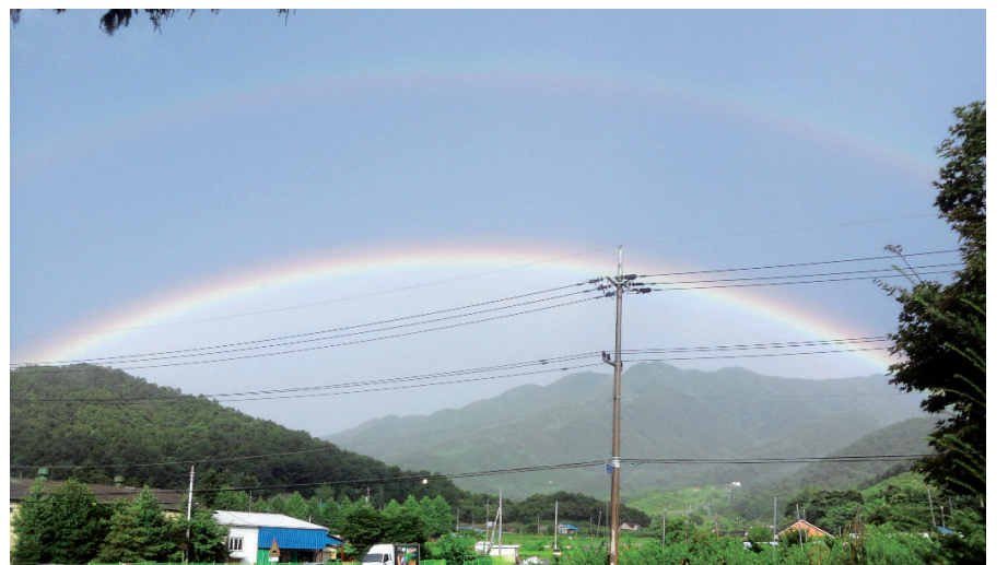
▲ 교육 전날 하늘에 나타났던 쌍무지개

끝으로 내게 감사한 점이 3가지가 있는데, 첫째는 청송 심문에 태어난 것을 감사한다. 둘째는 청송 심문에서 자란 것을 감사한다. 그리고 셋째는 먼 훗날 이 세상에서의 삶을 다하고 청송 심문으로 돌아갈 것을 감사한다.