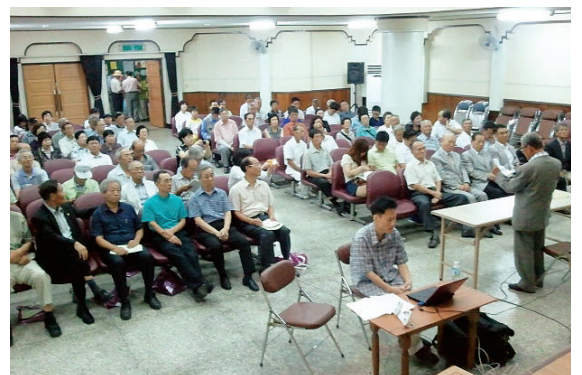
▲ 원주·횡성 정보 종회장 인사 모습