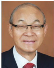
심 갑 보 대중회 부회장