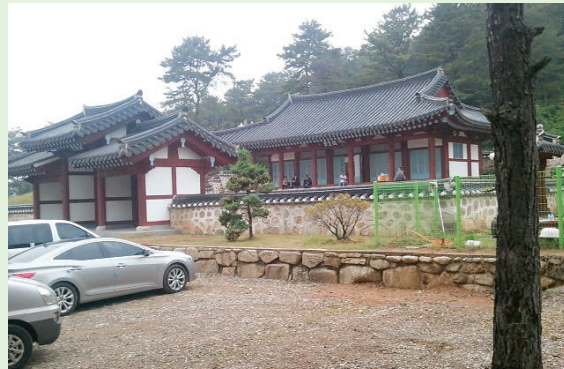
▲ 10월 13일(토) 준공식을 앞둔 공숙공종중 재실 전경

事業)을 하는 등 종중 자금을 효율적으로 관리하여 종중재산 증식(增殖)에 기여하고 있으며, 공숙공 묘역 일대는 물론 첫돌도 되지 않은 첫머리 한살의 아기를 등에 업고 선산 땅 구미까지 불원천리(不遠千里) 피신했던 유모의 묘소를 관리하여 수은망극(受恩罔極)에 보답하는 도리를 다하고 있으며 한편으로는 강주부공이 무후(无后)하여 우리 청송심씨 문중에서는 현재까지 500여년에 걸쳐 시향을 모셔오고 있다.