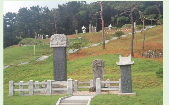
▲ 정화사업을 끝낸 공숙공 묘역 전경

※ 종·효의 본 이되신 공숙공 할아버지의 파란만장(波瀾萬丈)한 삶을 우리 종인들이 타산지석의 교훈으로 삼기 위하여 공숙공 할아버지에 대하여 언급 하였습니다.