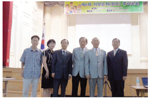
▲ 지방순회 뿌리교육 강사 및 진행요원