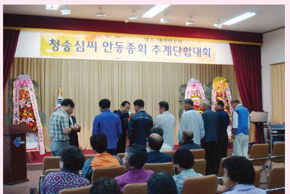
▲ 종회탐방 후 추계단합대회에 참석한 대중회 재서 문화이사가 안동종회 이사들에게 대중회가 새로 제작한 배지를 달아 주고 있는 장면