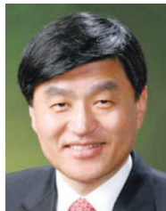
심 윤 조 국회의원

최근 가수 싸이가 '강남스타일'로 전성기 시절의 인기를 구사하고 있다. 젊은 세대를 열광시키며 전 세계인들의 마음까지 사로잡고 있는 '강남스타일'을 가장 먼저 배워야할 사람이 있다면 강남갑에서 당선된 심윤조 의원(59)이 아닐까.