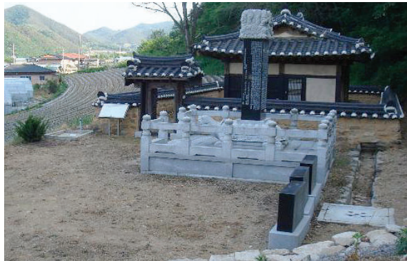
▲ 금번 국가문화재로 지정된 소류정 전경

었으나, 지난 1997년에 새로이 증건하여 2010년도에는 청송군 향토문화유산(유형유산) 제14호로 지정·관리되고 있다.