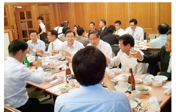
△ 제19대 국회의원 당선 종친들과 단합모임