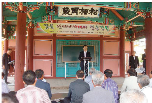
▲ 찬경루에서 열린 「경북 선비아카데미」 개강식

특히 이날 강연자 및 참석자 모두는 확트인 용전천 강변의 절경과 시원한 강바람을 벗삼아 우리 선조들의 얼