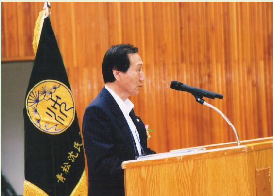
▲ 대종회 의락회장의 축사를 대독하는 차섭 부산종회 고문