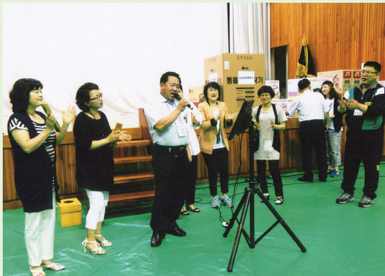
▲ 정기총회를 마치고 종원 가족들의 즐거운 노래한마당