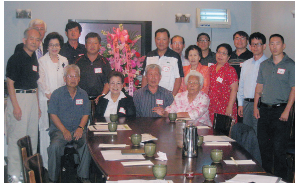
▲ 캐나다총회 결성 후 종친 기념촬영