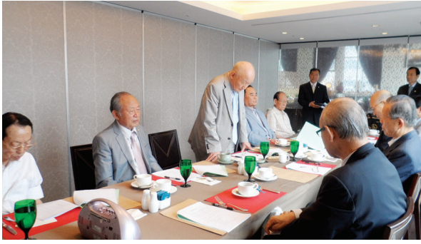
△ 2012년 2차 회장단회의 개최모습