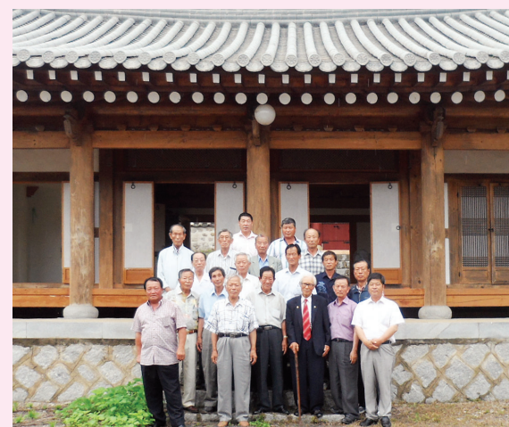
▲ 종회탐방 후 양계사에서 참석종인과 함께 ...

■ 다음 종회탐방은 지역종회로 9월 초 종회활동을 활발히 전개하고 있는 경북 안동지역종회(회장: 재덕) 예정입니다.