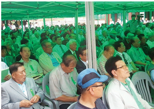
▲ 안효공종회 정기총회 참석 종인