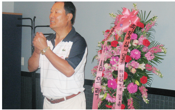
▲ 캐나다총회 상욱회장 인사모습(대총회 의락회장 축하 화환 기증)