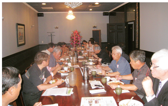
▲ 캐나다총회 창립총회 개최 모습