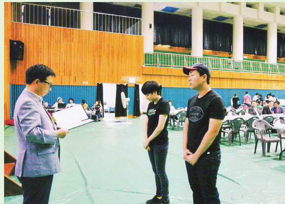
▲ 상군 부산종회장께서 장학금 전달