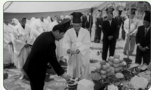
▶ 5世祖 도총제공 춘향