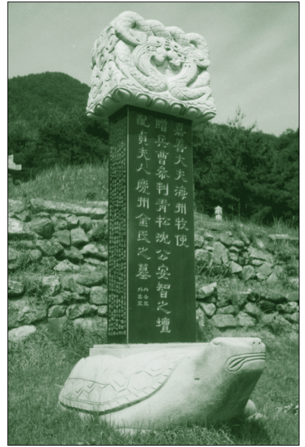
▶ 安智 之壇

八世祖 嘉善大夫 海州牧使 贈兵曹參判 青松沈公 안지(安智) 之壇 配貞夫人慶州金氏之墓 內壬坐 外癸坐