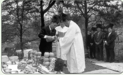
▶ 남양주 망세정공 춘향봉행