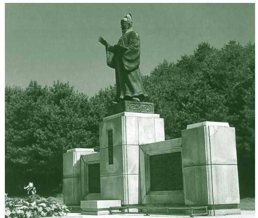
▶ 세종대왕 동상