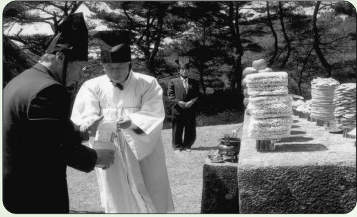
▶ 祭需費獻誠金 承澤(禮山) 300,000