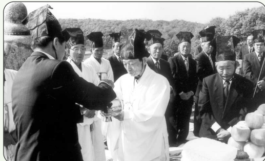
▶ 청성백 춘향봉행

青城伯 妣位 初獻：斗燮 弘澤 亞獻：原澤 承澤 終獻：隆求 忠燮 大祝：相直 相直 執禮：相稷 相稷 執事：載求 載澈