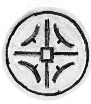
심승길씨 공모작 (밀양시 하남)