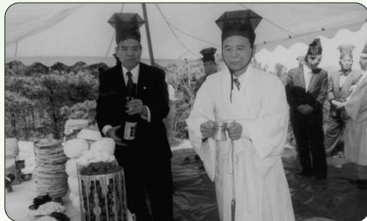
▶ 청화부원군 배위 김씨