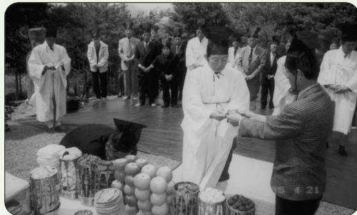
▶ 청화부원군 안성

府院君 妣位 初獻：斗燮 宜杓 亞獻：相旭 相基 終獻：玄根 富龍 大祝：光澤 光澤 執禮：相稷 相稷