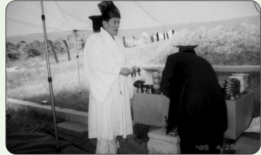
▶ 4世祖 초배위 청주송씨 춘향