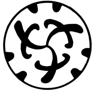
현재 사용하고 있는 도안