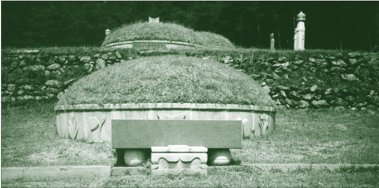
▶ 배위 정부인 경주김씨