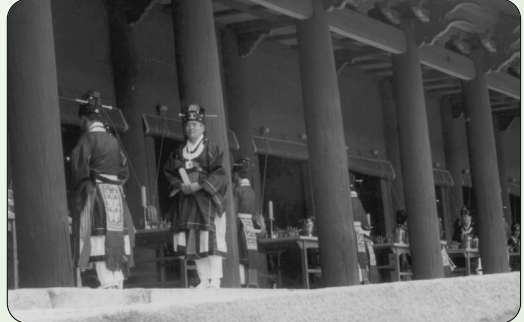
▶ 제실 앞 도열장면