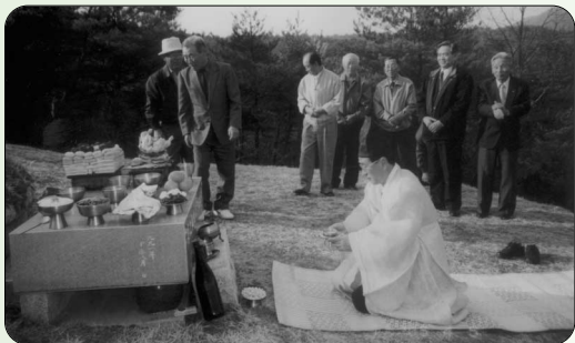
▶ 중대산 산소