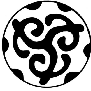
1955년 弘變씨의 도안