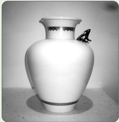
薩摩春風蝶花瓶 沈壽官 15代 (日) ( ) ( )